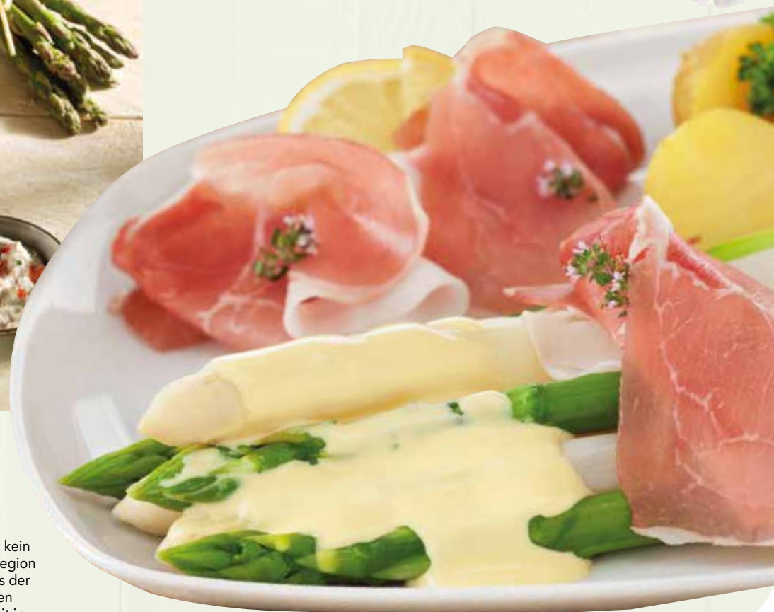
Spargel mit Sauce Hollandaise