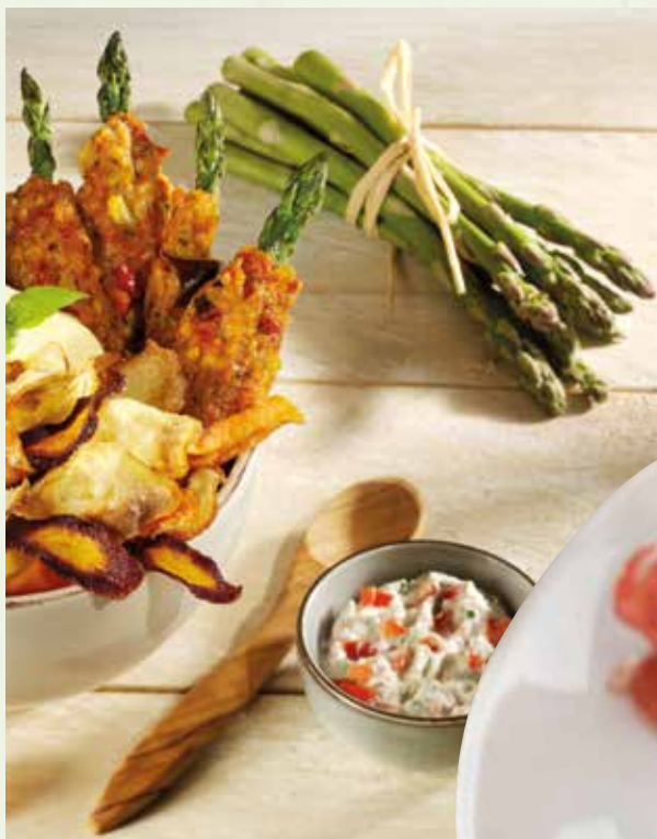
Spargel neu gedacht: BurgerCraft Burger mit grünem Spargel